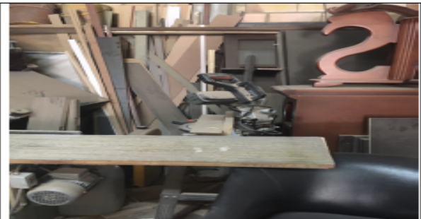
Fotografía No 5. Planeadora.