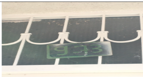
Fotografía No 2. Nomenclatura urbana.