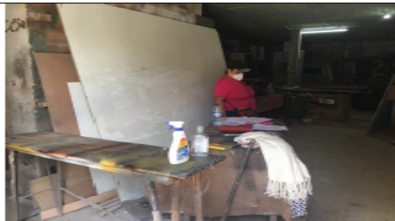
Fotografía No 6. Area de pintura.