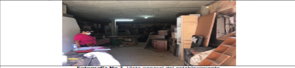
Fotografía No 7. Vista general del establecimiento.