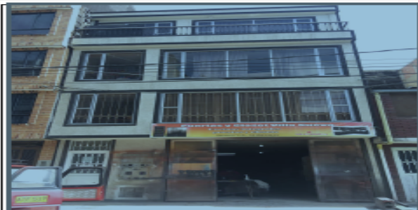
Fotografía No 1. Fachada del Predio.